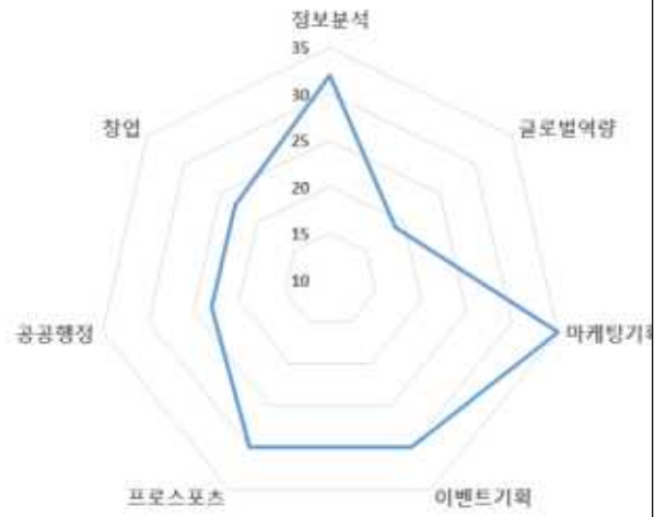
스포츠마케팅학과 교과목과 직무간 연계성