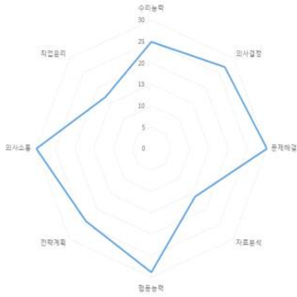
스포츠마케팅학과 교과목과 전공능력간 연계성