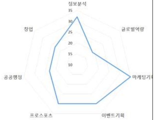
스포츠마케팅학과 교과목과 직무간 연계성